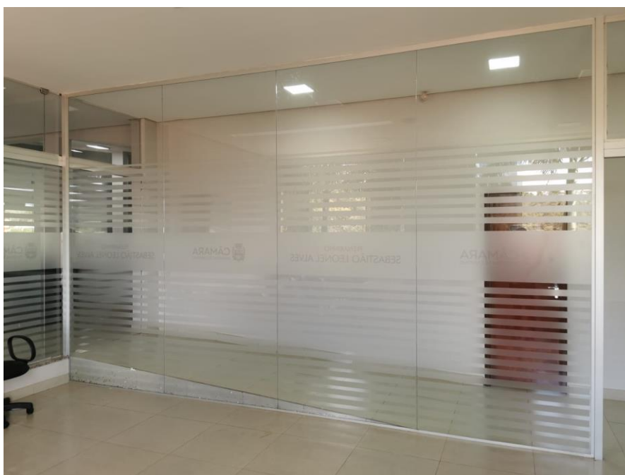
Foto 04 – Estrutura composta por 4 placas de vidro, em que uma delas será realocada (Item 10).

Estrutura de vidro temperado 8 mm existente, sendo composta por um vidro fixo superior de 0,90x2,73 m, um vidro fixo de 1,40x2,23 m e uma porta de correr de 1,67x2,25 m. Será mantida a mesma disposição dos vidros e o novo local de fixação é composto por um requadro com uma extremidade em vidro temperado e a outra em divisória de drywall e a parte superior é forro de gesso.